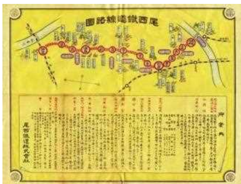
（クリックすると拡大）