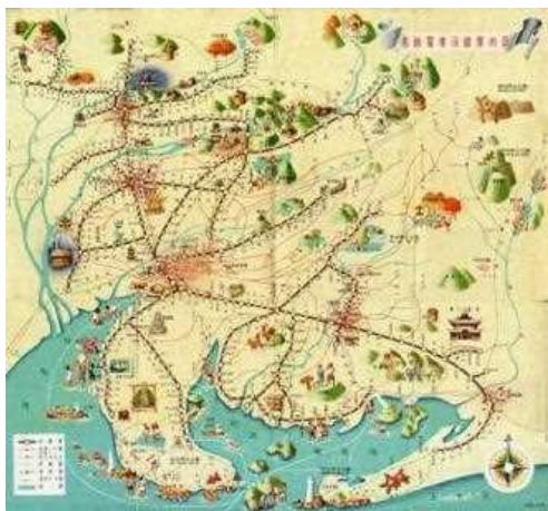
昭和27（1952）年の名鉄沿線案内図 （営業キロ:578.9km） （クリックすると拡大）