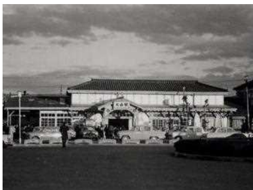
犬山線・犬山駅 昭和36年（1961）

2013（平成25）年3月24日～5月31日に名鉄資料館で開催した「名鉄沿線 いま・むかし」の中から展示資料の一部を御紹介いたします。