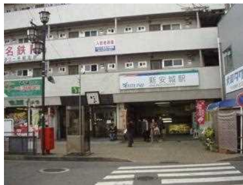
名古屋本線・今村駅 昭和34年（1959）（現在は新安城駅） 大正12年開業、昭和44年に4階建て駅ビル・地下駅舎が完成。昭和45年5月現在の新安城に駅名改称。