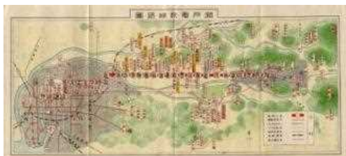
（クリックすると拡大）

尾西鉄道の弥富～津島は明治31（1898）年の4月に開業し、現存する名鉄路線の中では最も古い路線。順次路線を延伸し、明治33年に新一宮、大正3年に木曾川橋まで開通した。 大正14（1925）年8月1日に名古屋鉄道（初代）と合併し、名鉄尾西線となる。