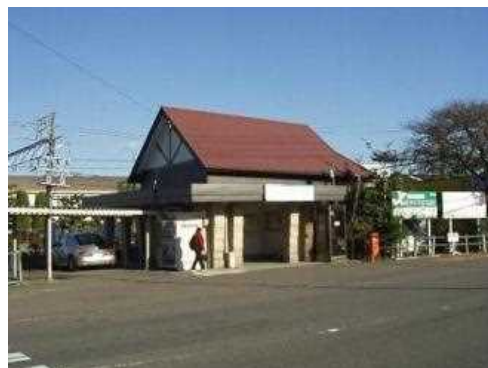
広見線・ライン遊園駅 昭和3年（1928） 大正14年「ライン遊園」駅として開業。昭和3年、ライン遊園～北陽館間に名鉄最初のバスを開業した。駅名は一時「土田」と改称されたが、昭和44年「見川」と改称されて現在に至る。駅舎は昭和3年当時の原型をとどめている。