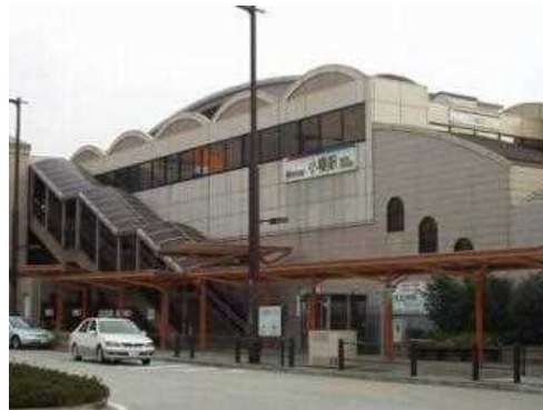
瀬戸線・小幡駅 昭和47年（1972） 明治38年瀬戸自動鉄道の駅として開業。昭和8年に寺院のお堂を模したユニークな駅舎が建てられた。昭和53年に改築されたが、平成11年駅前再開発事業で近代的な駅に変身した。